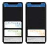
Smartphones Bluetooth® & NFC avec application STid Mobile ID®