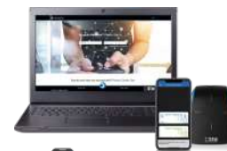
STid Mobile ID® Online Portal Plateforme Web pour une gestion à distance de vos badges virtuels

*Nos lecteurs lisent uniquement le numéro de série / UID de la puce iCLASS™. Ils ne lisent pas les protections cryptographiques iCLASS™ de HID Global.