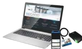
SECARD Kit de programmation SECARD et les protocoles SSCP, SSCP2 et OSDP™